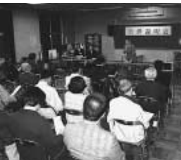
説明会で市長の説明を聞く皆さん