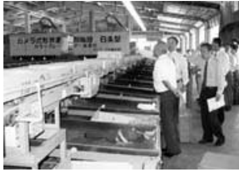
丹生川村のトマト選果場を視察

視察では、まちづくりに対する考え方、重点事業、財政状況などを聴き、また、主な基盤施設を回りその目的や状況などの説明を受けました。