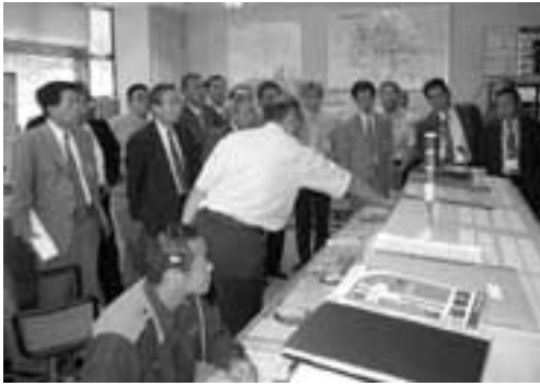
大野消防署（久々野町）を視察

新市のまちづくりに向け、地域の実状を把握しようと、市長のほか助役、市職員がそれぞれの町村を視察しました。