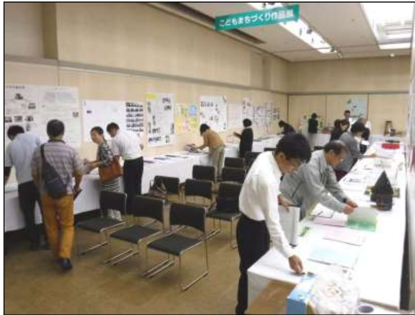
審査会の様子（平成30年9月13日）