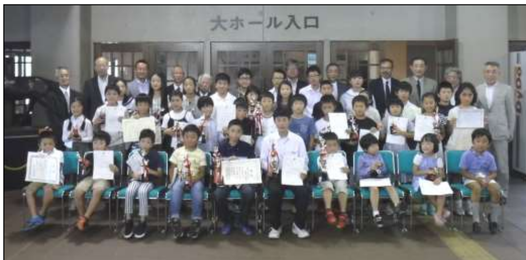
発明くふう展・未来の科学の夢絵画展の入賞者とともに記念撮影