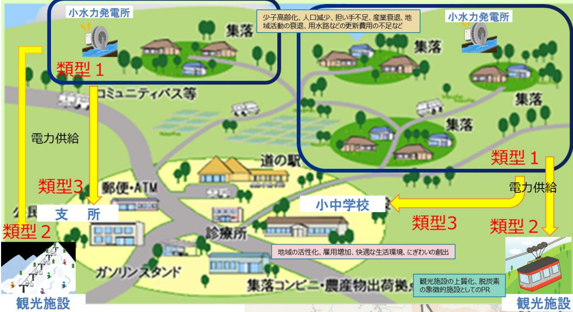
中山間地域の地産地消拡大イメージ

小水力発電所候補地や立地町内会等の同意については、これからご相談となる地域もあることに留意