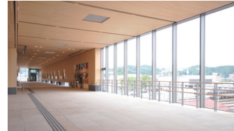
匠通り乗鞍口（東口）