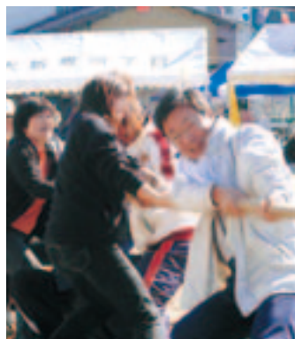
皆で力を合わせての綱引き

毎年10月に開催する「グランドフェスタ」は、会員総出の運動会で、連合町内会としても一大イベントとなっています。子どもからお年寄りまで参加し、大小11町内会が赤白に分かれて、大いに盛り上がります。昨年度は、社教や連合町内会が