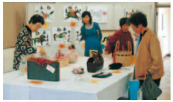
社教の各教室で学んだ作品を展示した北ふれあいギャラリー 2008.5.1