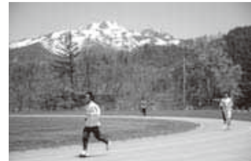
地域の活性化にも期待が寄せられる高地トレーニングエリア

ナショナルトレーニングセンターは、国内トップレベルの選手を強化・育成するために、国が整備・充実を進めているものです。今回指定された同エリアは、標高1300〜2200mに位置し、全天候型の400mトラックやランニングコースなどを備え、すでに陸上競技を中心に多くの選手が利用しており、昨年