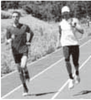
今年もフランスチームがやってきます

高根町日和田地区を中心とした「飛驒御嶽高原高地トレーニングエリア」が、文部科学省からナショナルトレーニングセンターの高地トレーニング部門の競技別強化拠点の指定を受けました。