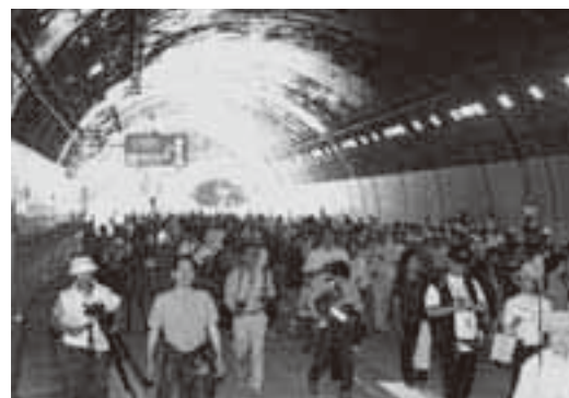
あまりの長さにみんなびっくり