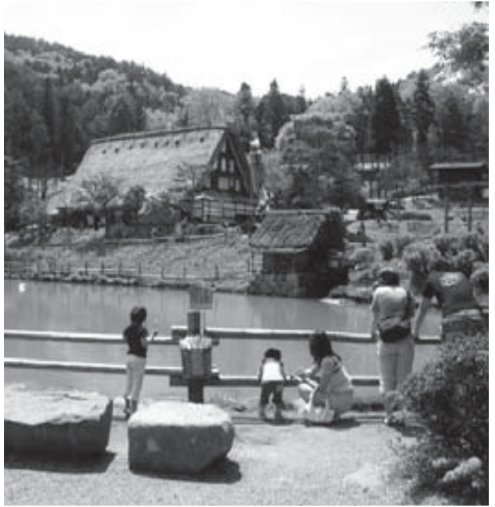
飛驒民俗村。指定管理者を募集する施設の一つです