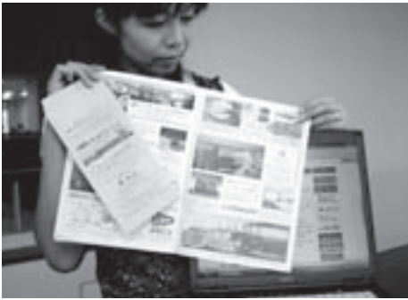
広告が掲載された窓口用封筒や観光パンフなど

この広告事業の導入にあたり、平成18年度から市職員によるワーキンググループを立ち上げ、広告掲載が可能と思われる100以上の媒体について検討を重ねてきました。その中から、市のイメージや景観なども考慮し、今年度は、市民課窓口用封筒、観光総合パンフレット、市ホームページに広告掲載を行うことで、約340万円の広告料収入を見込んでいます。 市では、今後も広告掲載が可能な媒体について検討を進