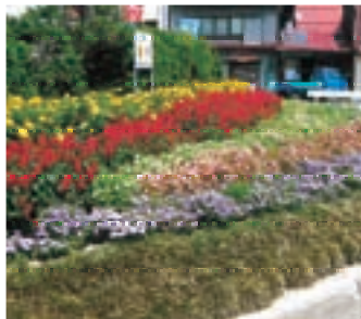
心癒される花いっぱいの花壇

今年度は、春に市民憲章推進協議会からサルビアやペゴニア、ペチュニアの花苗をもらい、各町内に配布し、現在きれいな花を咲かせています。また、秋には来春の地域を彩る花として、パンジーの苗やチューリップ、アネモネの球根を配布すること