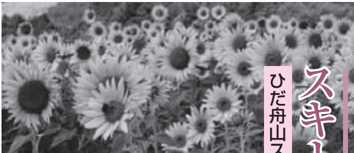
ひまわり園では多彩なイベントも開催されました