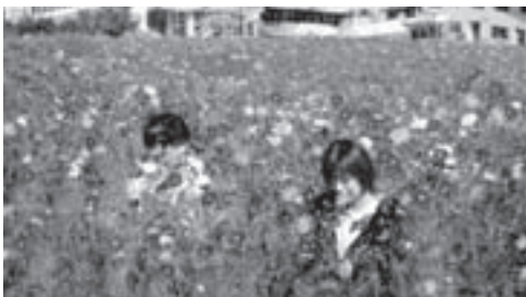
ゲレンデー面に咲き誇るコスモス

ひだ舟山スノーリゾートアルコピア(久々野町)に、今年もひまわり園がオープンし、ゲレンデー面を黄色く染める約10万本のひまわりが訪れたみなさんを楽しませました。