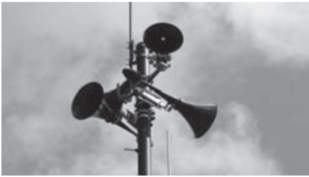
市内各所に整備されている屋外拡声器。有事の際の重要な情報伝達手段の一つです

自然災害は決して「他人事」ではありません。いつ、どこでも起こり得るものだという危機意識を持つことが大切です。災害が起きたとき、自分の住む地域を守るかどうかは、日ごろからの物心両面の備えと地域社会の助け合いにかかっています。