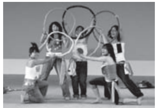
エネルギーあふれる創作ダンスが披露されました