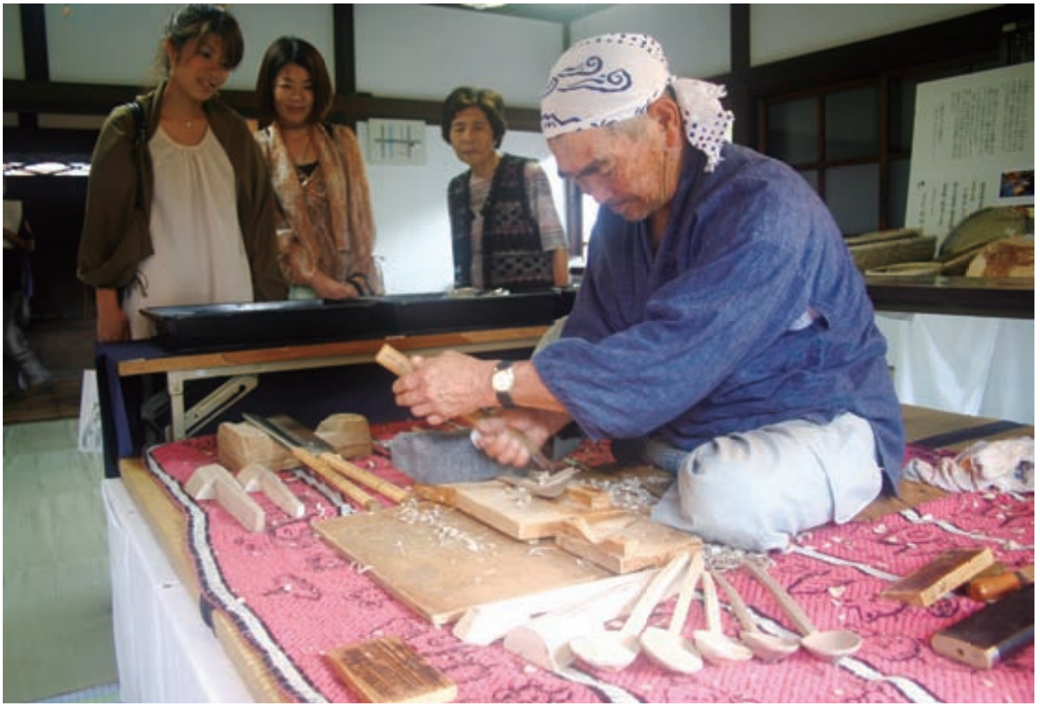
連綿と受け継がれる伝統の技 (飛騨の伝統的工芸品展で有道しゃくしの制作実演) 8月21日撮影 高山地域