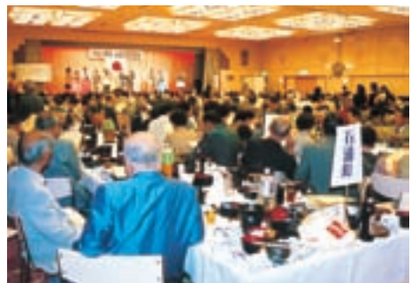
敬老会を楽しまれるみなさん