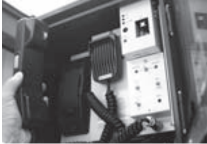
拡声器には無線電話が備え付けられ、市役所本庁と通話ができます。訓練中は試験交信が可能です