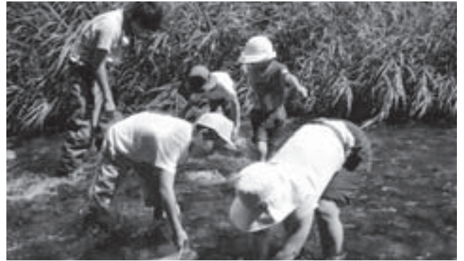
川にすむ生物により水質を調査(カワゲラウォッチングの様子)