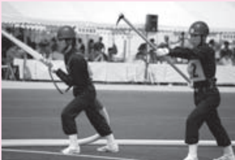
猛暑の中、訓練の成果を発揮した清見支団のみなさん