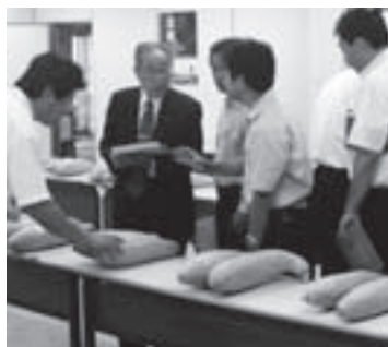
品評会では出来栄を競います