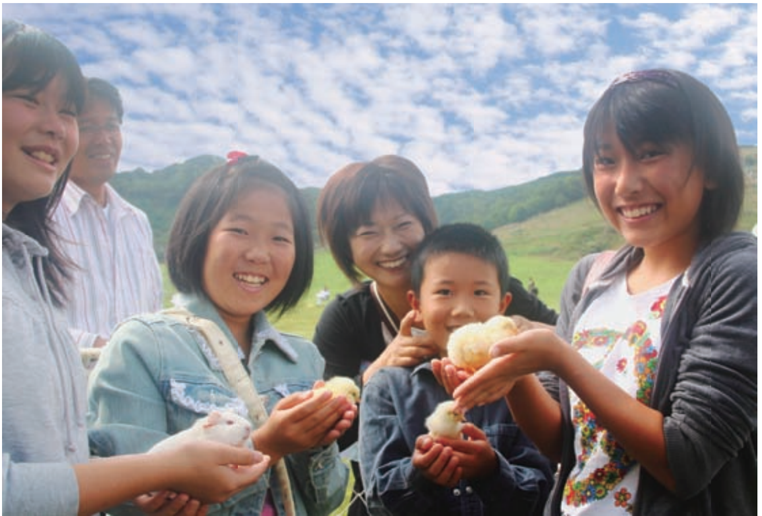
動物とのふれあい。温もり・優しさ・愛しさを実感 (「動物愛護フェスティバルin飛騨」が行われました) 9月23日撮影 一之宮地域