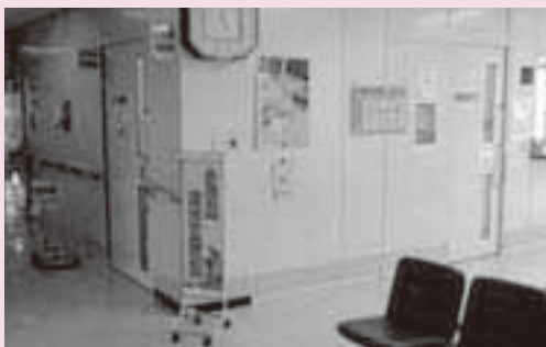
久美愛厚生病院に設置される小児夜間初期救急診療支援室