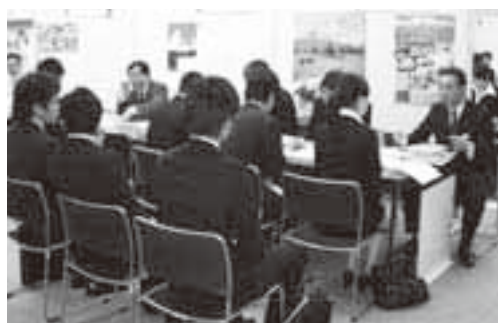
ガイダンスの様子