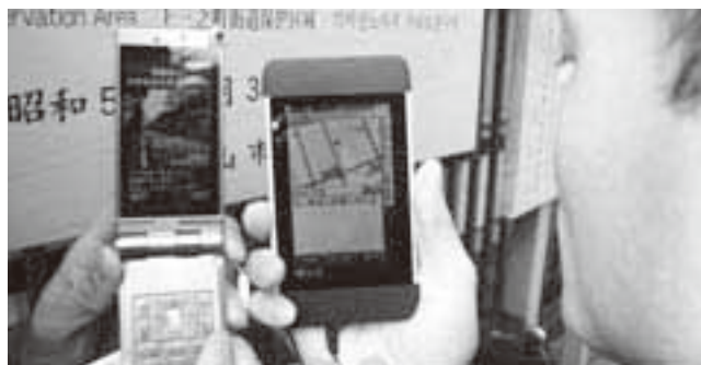
携帯端末からはさまざまな情報が提供されます