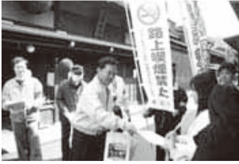
路上喫煙禁止区域での啓発活動