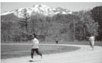
トレーニング環境が充実する 高地トレーニングエリア