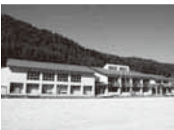
旧日和田小学校の校舎