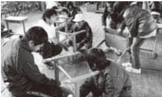
海外支援の準備に取り組む児童(国府小で)