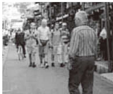
高山市を訪れる外国人観光客は年間17万人を数えます

市では、海外からの交流人口の拡大や国際力のある人材の育成などを推進するため、「おもてなし国際化促進事業」を新設。民間事業者などが外国人を受け入れるために自主的に行う国際化推進の取組みをバックアップします。