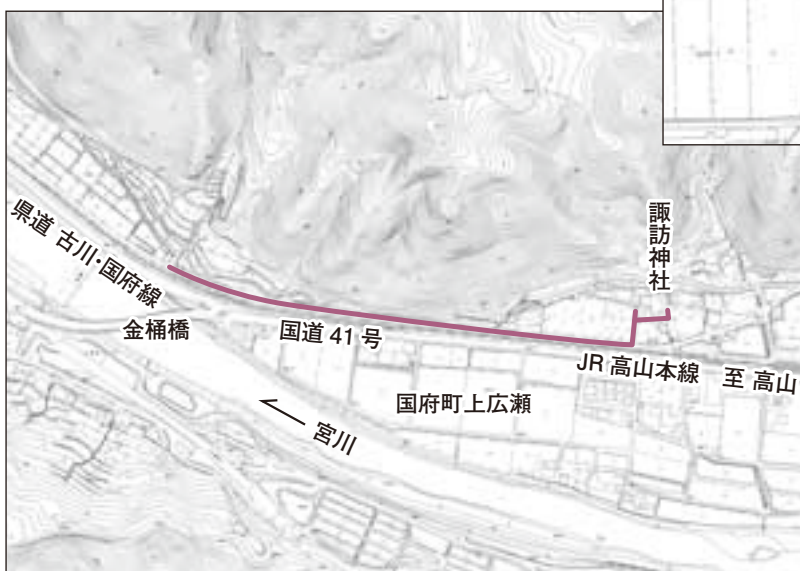
▲特定環境保全公共下水道事業(国府町上広瀬)