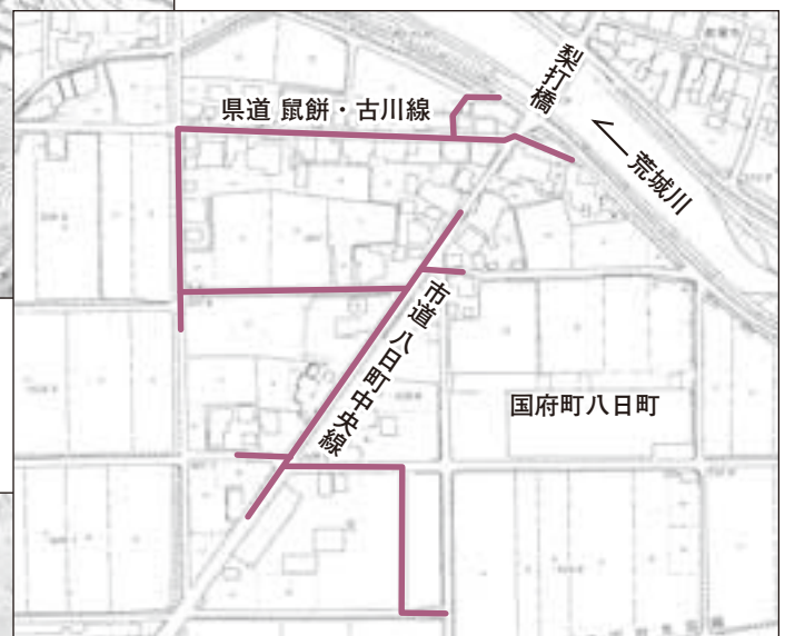
▲特定環境保全公共下水道事業(国府町八日町)