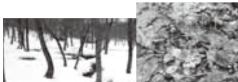
ギフチョウウが生息するヒメカンアオイの生息地(写真右上はヒメカンアオイ)

樹高8m ▽サクラ(久々野町阿多粕) 樹齢約4百年、幹周り2.9m、 樹高25m 保存地区 ▽ギフチョウウ・ヒメカンアオイ生息地(莊川町野々俣) 面積10.9万㎡