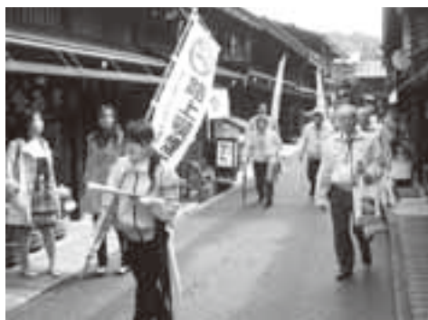
4月1日に行われた啓発活動(古い町並)