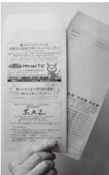
昨年度、募集により作成した封筒