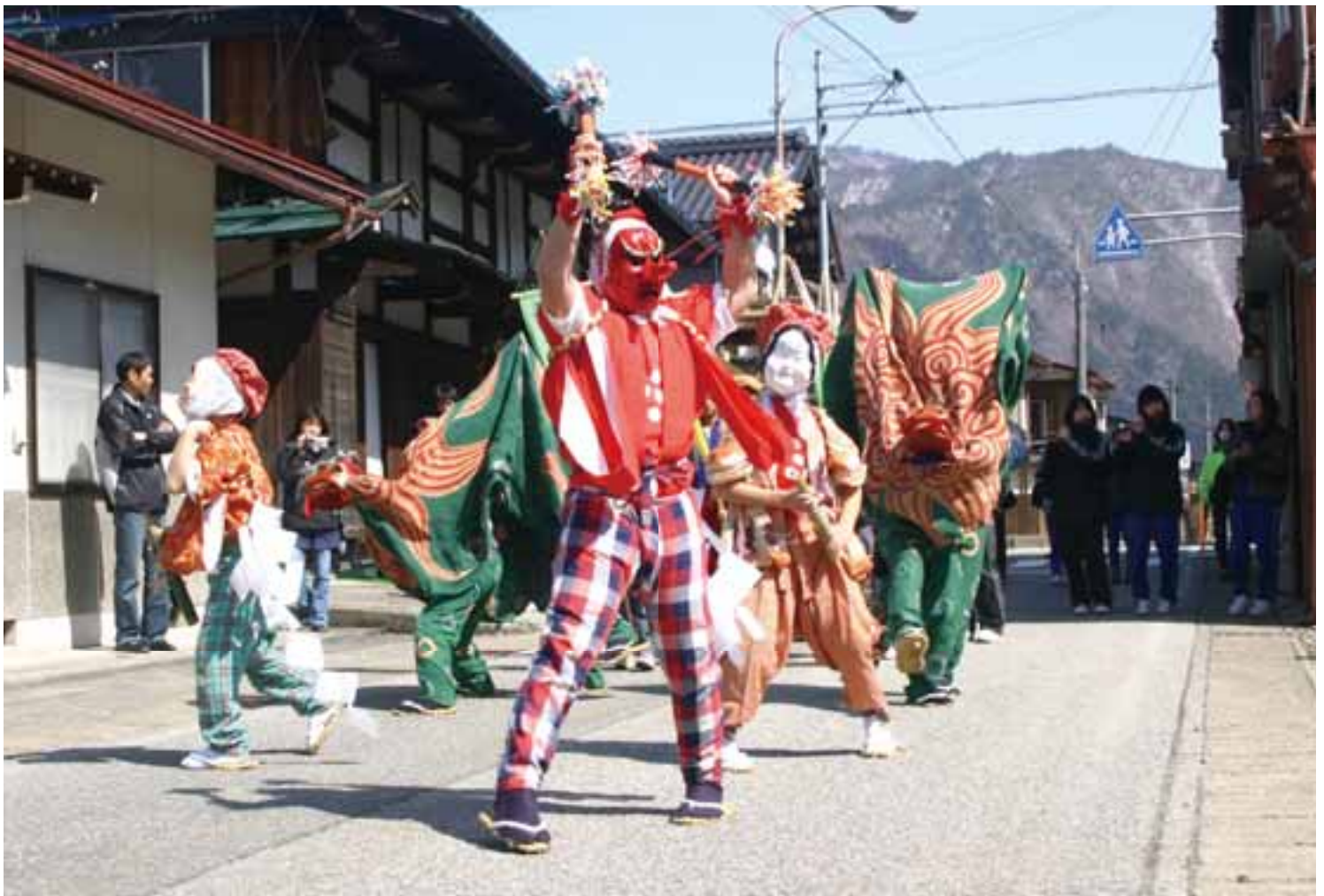
郷に春を告げる子どもの舞 (子ども祭り 上宝町 4月3日撮影)