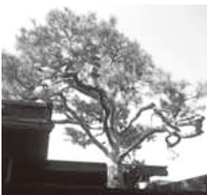
上三之町のアカマツ

樹高8m ▽サクラ(久々野町阿多粕) 樹齢約4百年、幹周り2.9m、 樹高25m 保存地区 ▽ギフチョウウ・ヒメカンアオイ生息地(莊川町野々俣) 面積10.9万㎡