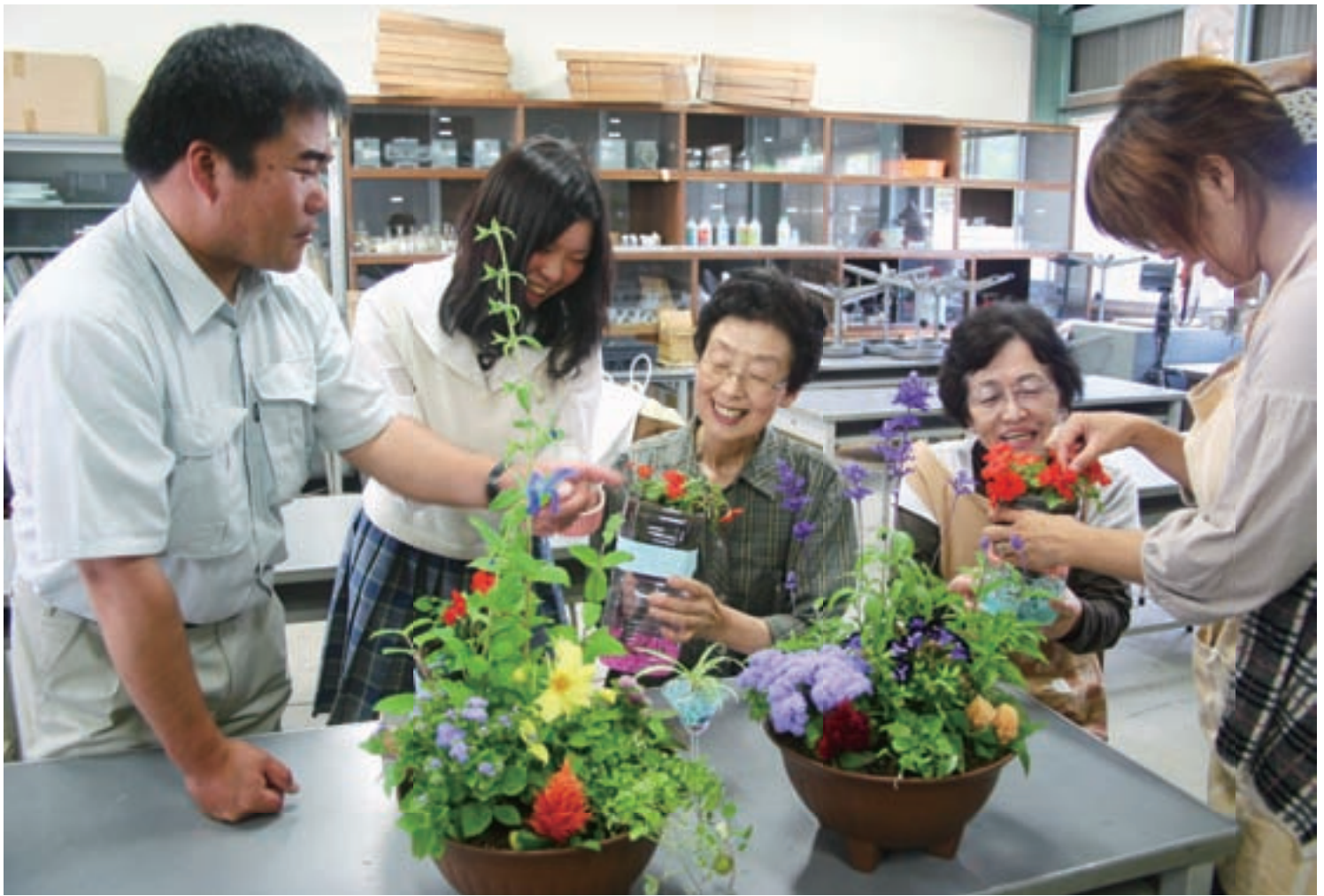
寄せ植えに思いと笑顔添えて (市民憲章推進協議会「花づくり講習会」が開かれました) 6月20日撮影 飛騨高山高校山田校舎