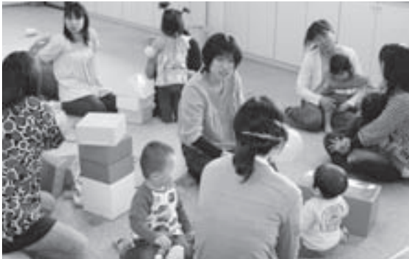
国府町の「つどいの広場」