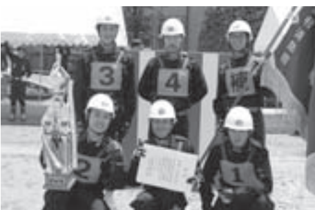
優勝した一之宮支団のみなさん