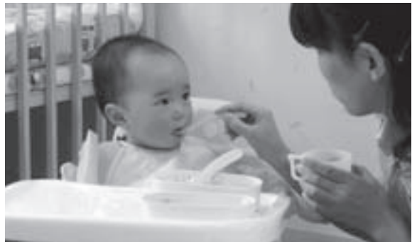
専門のスタッフが対応する病児保育。仕事との両立をサポートします