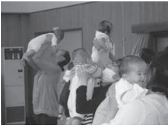
赤ちゃんとのコミュニケーションするための「ベビーサイン講座」