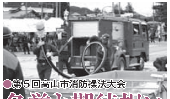
●第5回高山市消防操法大会