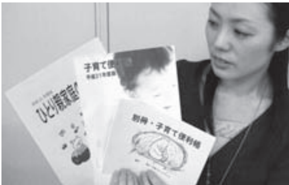
子育て情報がぎゅっとつまった「便利帳」