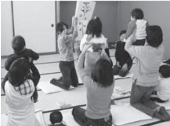
ブックスタート事業(大型絵本を使った読み聞かせの様子)