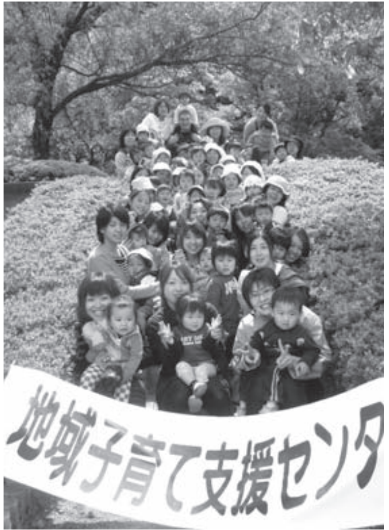
地域子育て支援センターの行事の一コマ。親も子も“にっこり”