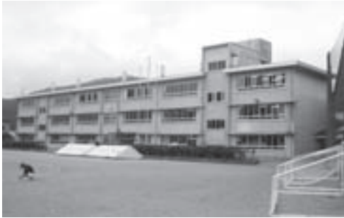
改修工事が始まる国府小学校の南舎

▽消防ポンプ自動車2台(千島、荘川)と小型動力ポンプ積載車(一之宮)の購入 ▽国府小学校南舎改築工事(建築)請負契約の締結