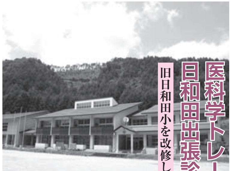
旧日和田小を改修し、高地トレーニングセンターとしてスタートする「飛騨高山御嶽トレーニングセンター」