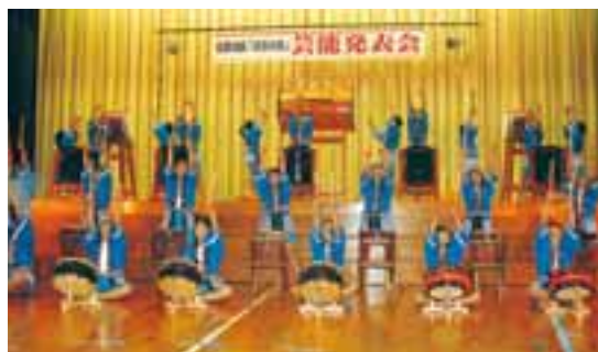
多彩なステージが人気の芸能発表会

II部は、客席の周りに展示パネルを設置して、一年間に習得した成果を展示します。花里小児童の書道に加えて、盆栽山野草・書道・絵手紙・きもの・ガラスワーク・絵画・水墨画・写真など地区にお住まいの方々にも展示に協力いただいています。また、女性部の協力によるバザーは大好評で毎年完売です。