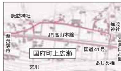
特定環境保全公共下水道事業(国府町上広瀬)