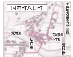
特定環境保全公共下水道事業(国府町八日町)