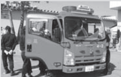
更新された消防ポンプ車(千島)

高山消防署および荘川支所、一之宮支所前駐車場で、それぞれ消防団への受渡式が行われ、団員が新車両の操作方法などを確認しました。