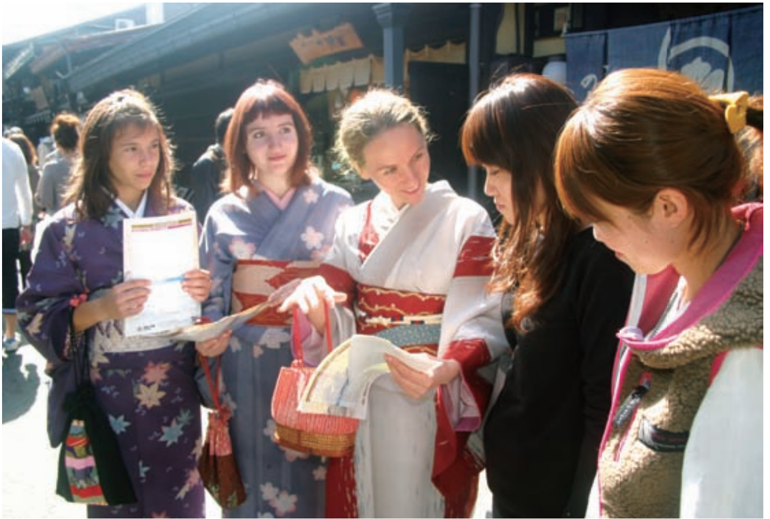
着物姿で飛騨高山のPRに一役 (ルーマニア・シビウ市の女性が観光ボランティア 10月10日撮影・高山地域)