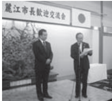
麗江市長歓迎交流会では、市民のみなさんに寄附していただいた図書472冊を寄贈しました。ご協力ありがとうございました