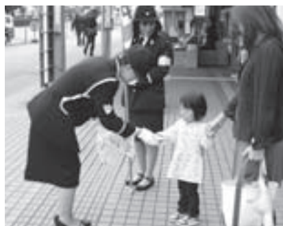
10月17日には交通安全推進員のみなさんが街頭啓発を行いました

○夕暮れ時・夜間やトンネルなどでは、ライトを早めに点灯し、交通事故防止に努めましょう。