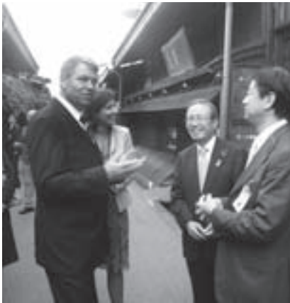
土野市長の案内で古い町並を散策するクラウス・ヨハニス市長