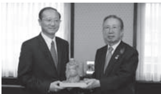
邵局長(左)に一位一刀彫の記念品を手渡す土野市長

10月17〜21日までの5日間、「第4回日中韓観光大臣会合」が日本(名古屋市・高山市)で開催されましたが、大臣会合に先立ち17日には、麗江市(中国雲南省)との友好都市提携の際からご尽力いただいている邵琪偉(シヨウキヱイ)国家旅游局長(観光担当大臣)が高山市を訪問。土野市長と対談して旧交を温めました。