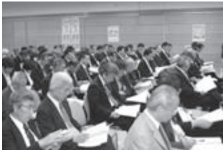
設立総会には130人を超える各種団体の代表が集まりました

今回設立した実行委員会は、市民の総力を結集して高山市での競技会を成功させようと、市の関係者、