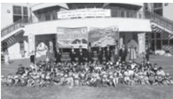
回遊旗をバックに参加者がそろって記念撮影