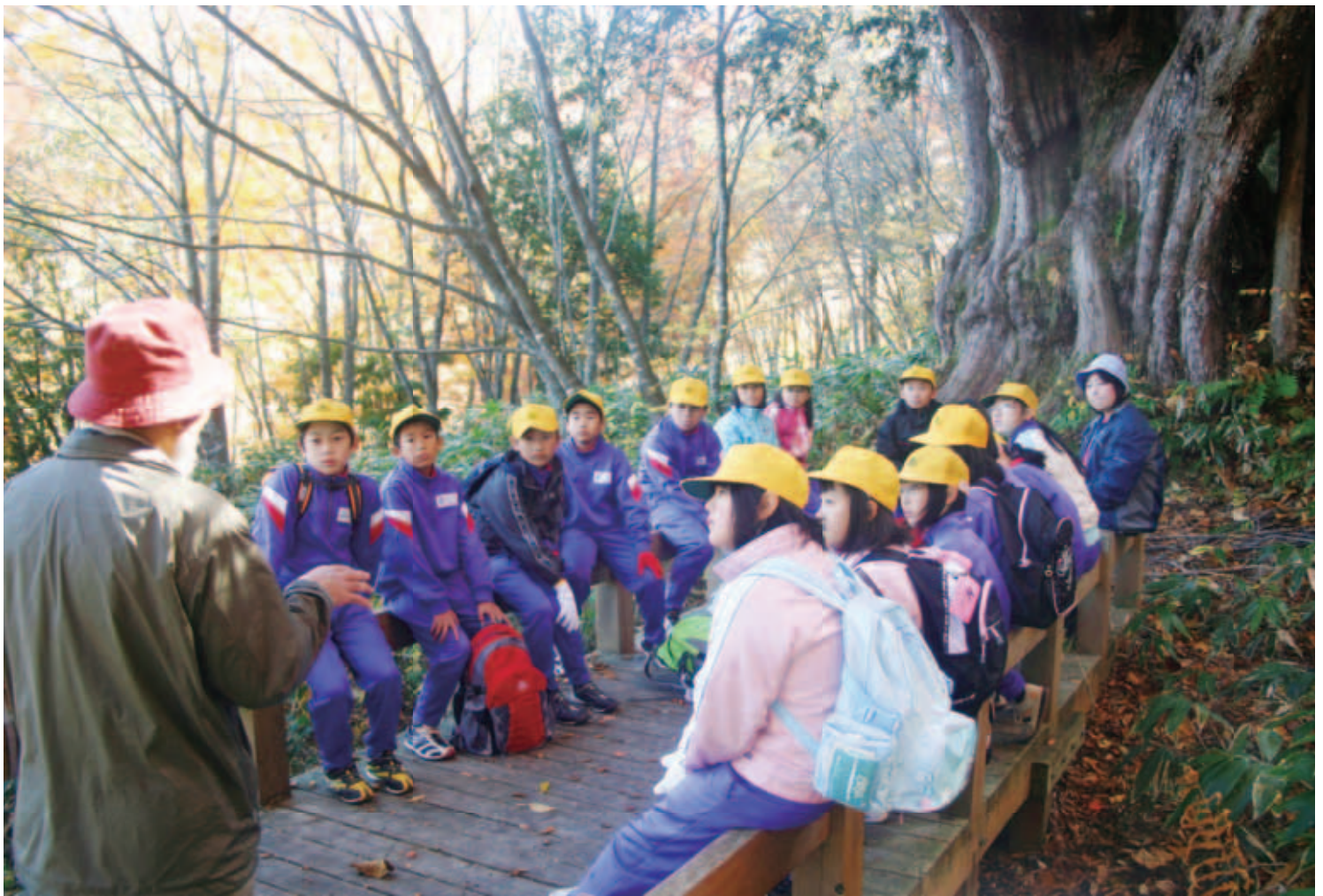
私たちの教室は、樹齢1,000年「森の守り神」 栃尾小5年生が「平湯大ネズコ」の前で森林環境教室 (10月23日撮影・奥飛騨温泉郷地域)