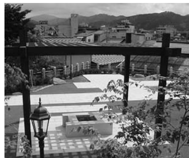
歴史的景観が楽しめる公園