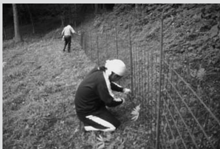
地域でのイノシシよけ防護柵の設置作業

この計画は、①鳥獣被害に強い地域づくり②鳥獣の追い払いや被害防止施設の整備③鳥獣の捕獲や捕獲実施者の育