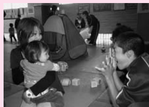
笑顔がいっぱい。(乳幼児親子ふれあい事業で)