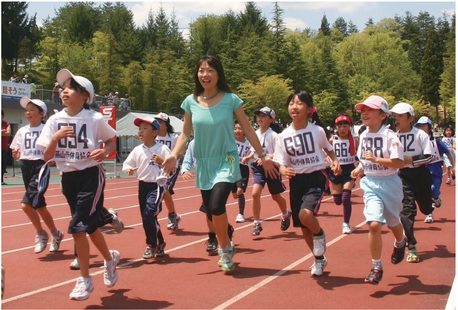
金メダリストと「風」になった日 (勸高山市体育協会合併5周年記念事業 「高橋尚子さんと走ろう!話そう!」 5月16日撮影・高山地域)