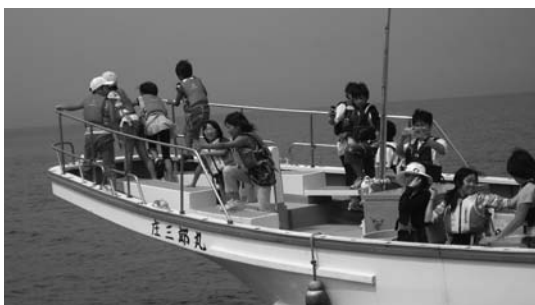
海風をきってのクルージング