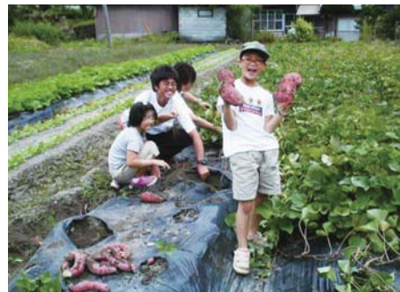
さつまいもの収穫を体験する家族旅行者