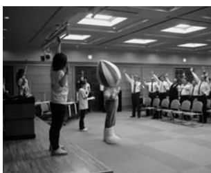
リズムに合わせて軽快なミニダンスや体操を披露しました

なお、総会に先立ってぎふ清流国体PRキャラバン隊「チームミナモ」による国体ソング「はばたけ未来へ」の曲に合わせたミナモダンスとミナモ体操の披露があり、出席者全員が音楽に合わせて背すじを伸ばすなど体をリフレッシュしました。