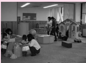
設備の充実も進めています。写真はつどいの広場（きよみ館）