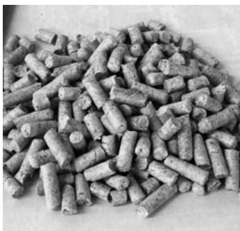
間伐材などを活用したペレット燃料。バイオマスの一つ

主な取組みとしては、高山市の広大な森林から発生する間伐材を有効活用するため搬出費用への助成を行うほか、木質ペレット燃料、ペレットストーブの普及、てんぷら油のバイオディーゼル燃料化やハンドソーブ化、家畜排せつ物堆肥の利用を促進するなど、バイオマスの利活用を推進していきます。