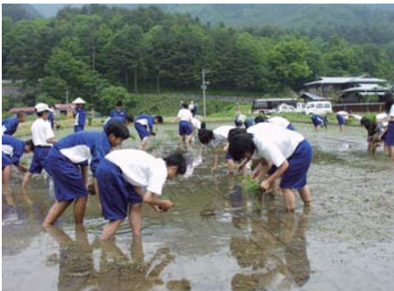
田植えを体験する中学生

現在は、修学旅行、教育旅行、国が進める「子ども農山漁村プロジェクト」など1年を通じ10校ほどの受入やモニターツアーなどを実施しています。各宿では、それぞれに趣向を凝らして、一之宮町の魅力を存分に味わっていただけるように、さまざまな体験メニューを準備して、たくさんのお客様のお越しをお待ちしています。