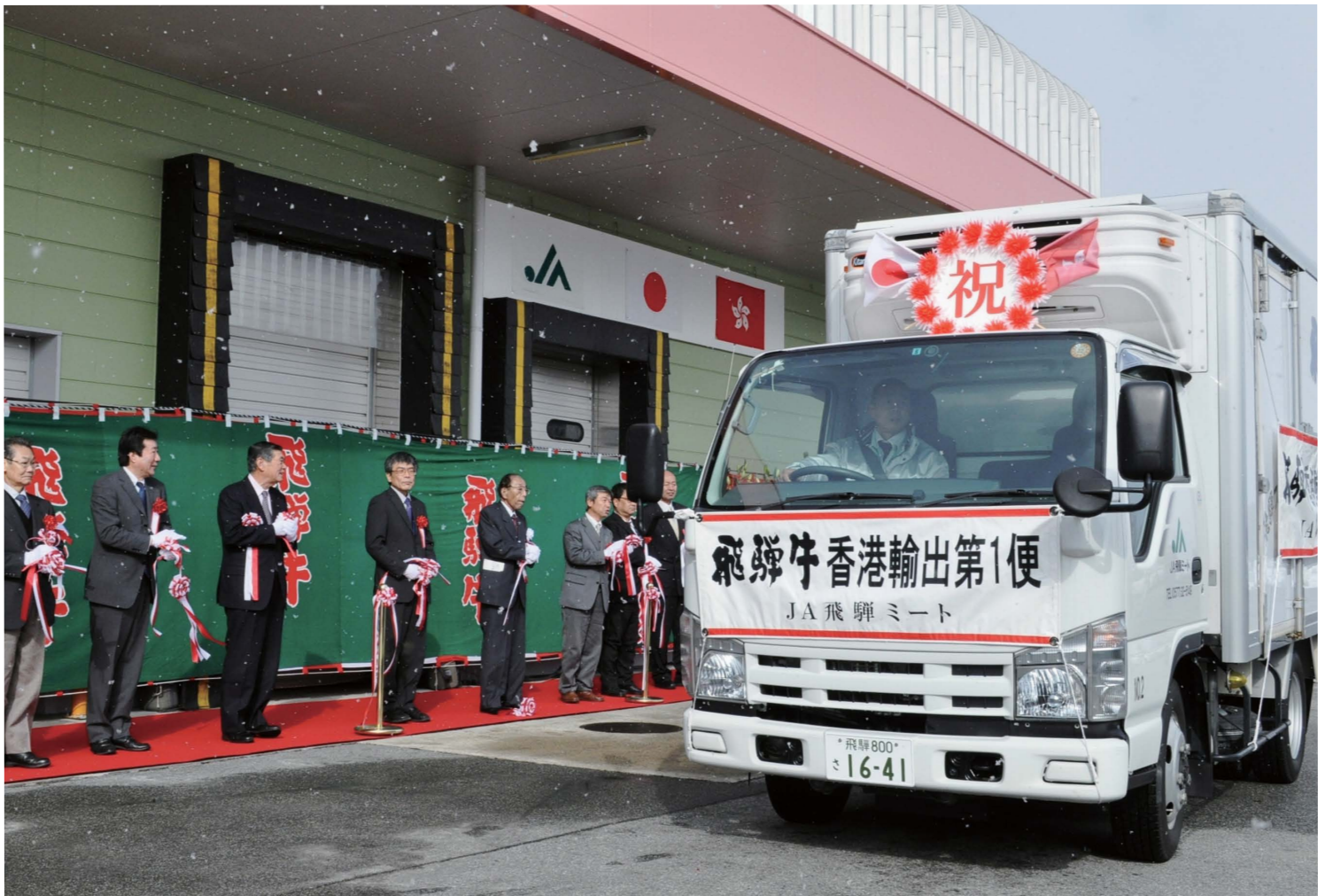
海を越えて。飛騨牛、香港へ JA 飛騨ミートで「飛騨牛」香港初輸出の出発式が行われました (1月7日撮影・高山地域)