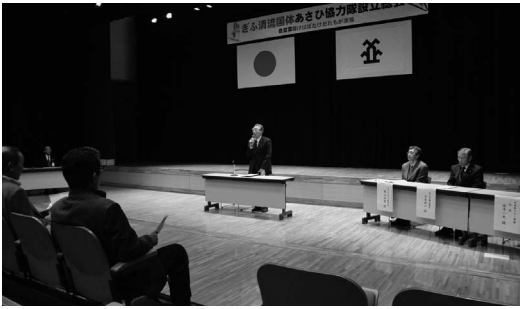
設立総会のような様子

ぎふ清流国体あさひ協力隊の設立総会が12月14日、朝日町の燦燦朝日館で行われ、60人が参加しました。