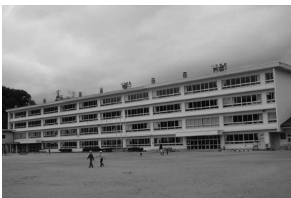
改築が予定されている東小校舎