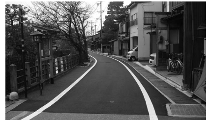
江名子川沿いの散策路