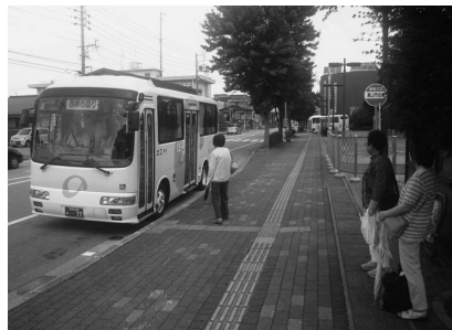
市民の足として稼働しているのらマイカー