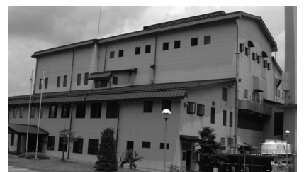
今後整備予定の資源リサイクルセンター

焼却施設の延命化対策として電気計装設備を更新するほか、新しい施設建設に向けて基金積み立てします。