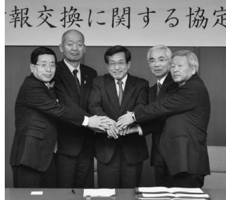
富田局長☉と飛驒地域の首長