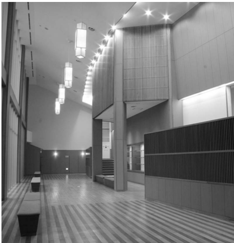
開放的で明るいホワイエ

公民館 7月1日(金)午後1時30分～ 図書館 7月1日(金)午後1時30分～ さくらホール 7月1日(金)午後1時30分～ 支所執務室 7月4日(月)午前8時30分～