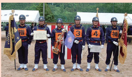
優勝した高山支団八幡班のみなさん

の厳しさを知る半面、高山の 町人の贅沢な暮らしぶりがよ く分かります。 これらの間取り図と現在残 っている古い町家の間取りを 比較してみると、ほとんど変 わっていないことに気づきま す。高山の町家の伝統は、現在 まで受け継がれているので す。