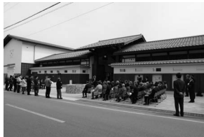
飛騨高山まちの博物館