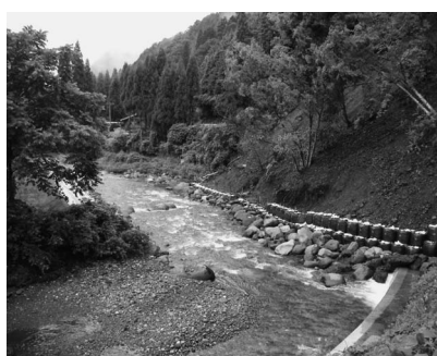
応急対策後(7月22日)の状況

対策工法を決定し、斜面工事、市道工事、河川工事を順次、行っていく予定です。 みなさまへお願い この崩壊斜面付近には絶対に立ち入らないでください。