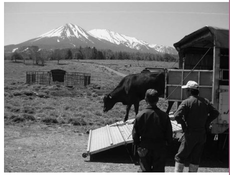
地産地消：地域で生産されたものを、その地域で消費すること

者の間に「顔が見え、話ができる関係」が作られ、食べ物と食べ方の本来のあり方を双方がともに考え直し、地域の食文化の見直しなどにつながっていきます。