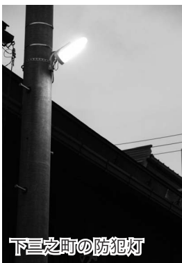
下三之町の防犯灯