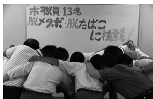
円陣を組み 気合を入れる 13人の職員

今回挑戦する13人は、来年2月の健康診断で劇的に改善することを目標にしていますので、その経過をどうぞご覧ください。