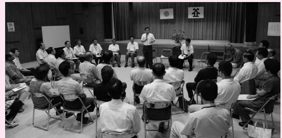
8月2日に行われた高根会場のようす

みなさんからいただいたご意見やご提案は、今後の施策や事業に活かしていきたいと考えていますので、ぜひお誘い合わせの上、ご参加ください。