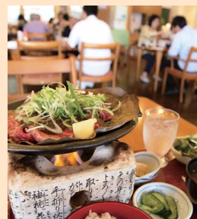
割引メニュー例 「飛驒牛ほう葉味噌焼肉御膳」

同会は道の駅や飲食店、観光協会や商工会、畜産農家団体など8団体から構成されており、毎月最終土日を「飛驒牛の日」として飛驒牛メニューの割引や飛驒牛関連商品の提供を行っています。これを機会にぜひ飛驒牛を清見町で味わってください。