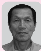
瑞宝単光章(防衛功労)