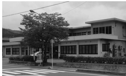
改築する清見診療所