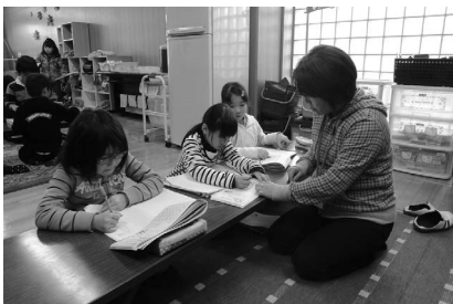
留守家庭児童教室