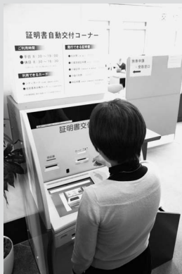
待ち時間の少ない自動交付機

※ご利用にあたっては、住民基本台帳カードまたはシティカードが必要です。お申込みは市民課または各支所地域振興課まで。