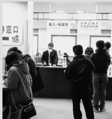
混雑時の窓口のようす