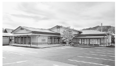
昨年の「建築物の部」奨励賞の一つ、石浦町公民館の「石浦うらら館」

申込方法 ●8月31日(金)までに、都市整備課またはHPにある応募用紙にカラー写真2枚（近景と遠景）、位置図、平面図（建築物の部のみ）を添えて提出