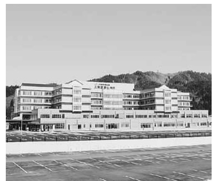
病院の施設設備を支援しました