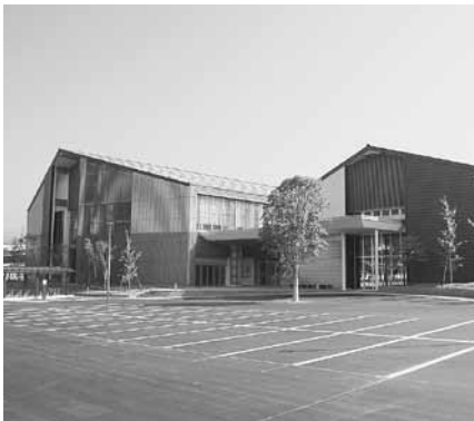
こくふ交流センターオープン