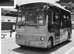
のらマイカー㊦やまちなみバス㊦を運行しました