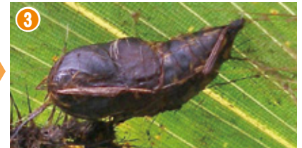
幼虫は2カ月ほどで発育を完了し、樹幹、物陰などでサナギ(3～4cm)となります。サナギの期間は十数日です。