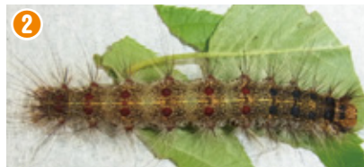
6月中旬から7月上旬頃の幼虫(6～7cm) 最大で8cm程に成長します。頭はオレンジ色、黒いハの字の斑点があります。体の色はかなり変異があります