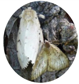
マイマイガの成虫(左:メス/右:オス)