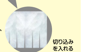
切り込みを入れる