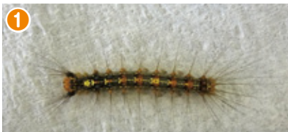
6月上旬頃の幼虫(2～3cm) 広葉樹の葉などを食べながら通常5回程度脱皮を繰り返し、大きくなります