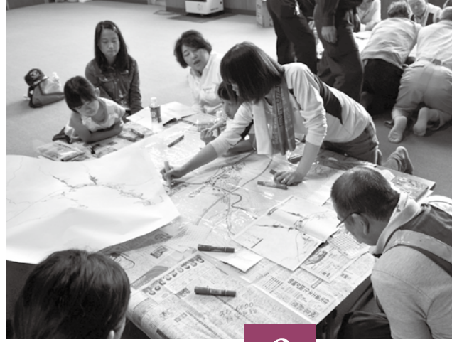
土砂災害防災訓練(図上訓練)のようす (6月1日・荏川町)