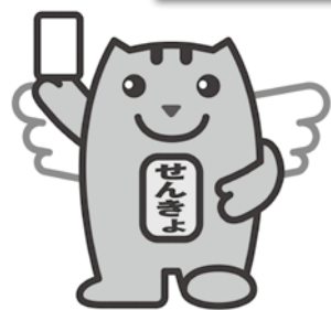
みんなの一票大切に!

8月31日(日)は高山市長選挙の投票日です。高山市の明るい未来をつくる大切な選挙に、みなさんそろって投票しましょう。投票日に投票できない方は、期日前投票をしまじょう。