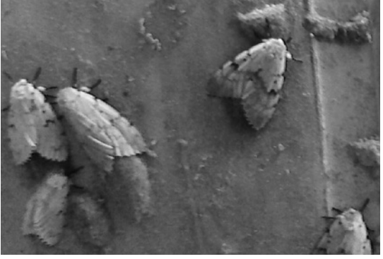
▶今年の産卵の様子 (8月1日撮影)