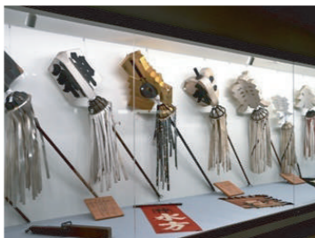
高山の火消組の纏（まちの博物館）

実質的な対策の一方で、火の用心の意識を高めようとする。東海・甲信エリアに広まったのが、火防・火伏の神「秋葉様の信仰」でした。 江戸時代の旅の目的の一つに「参拝」がありました。交通手段が発達していない当時