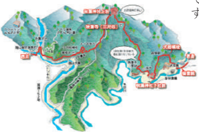
標高866mの秋葉山山頂付近の秋葉神社

一人の大切なもの、旅は一大事。お金もかかり、気軽に行けるものではない。代理参拝組織「講」で、その代金を出した。旅に出るのです。 静岡県浜松市、赤石山脈の南端に位置する秋葉山。秋葉神社への代理参拝が「秋葉講」です。