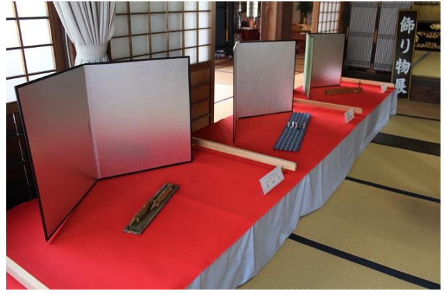
道具を使っているいろいろなものを表現します