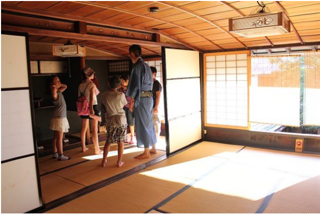
宮地家では町家について学習