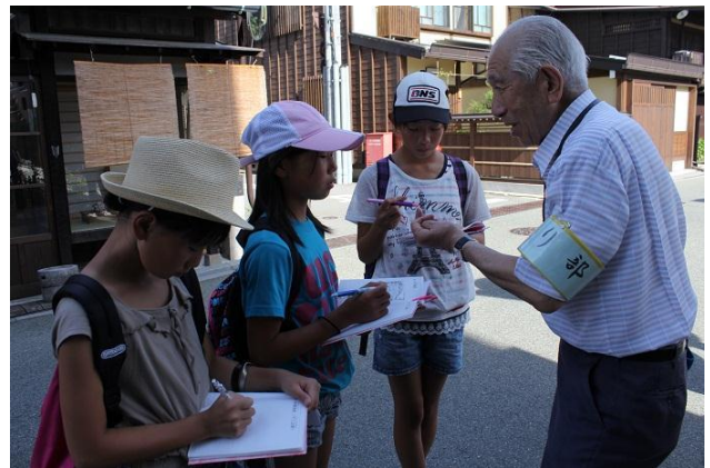
下二之町では町並保存を学習