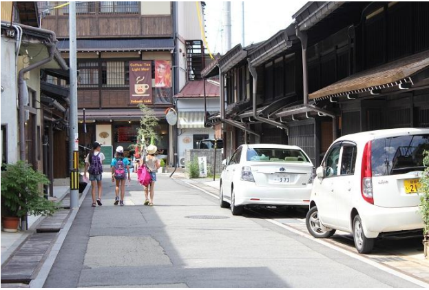
大新町の町家を眺めながら目的地へ!