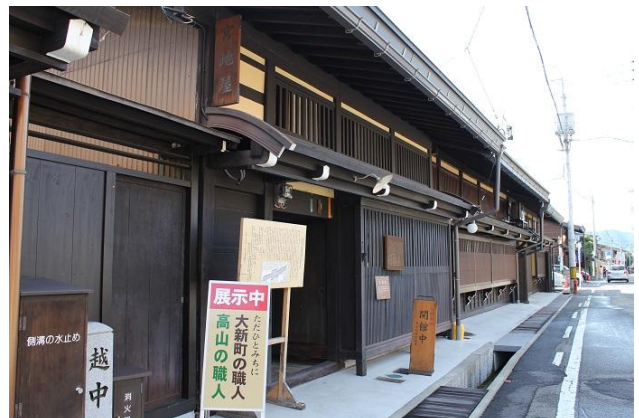
最後の宮地家にて