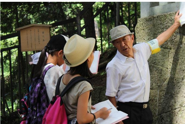
祟り石にまつわるお話を学習