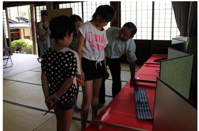
解説を聞きながら伝統を学習