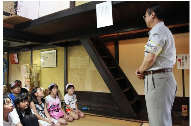
お疲れさまでした