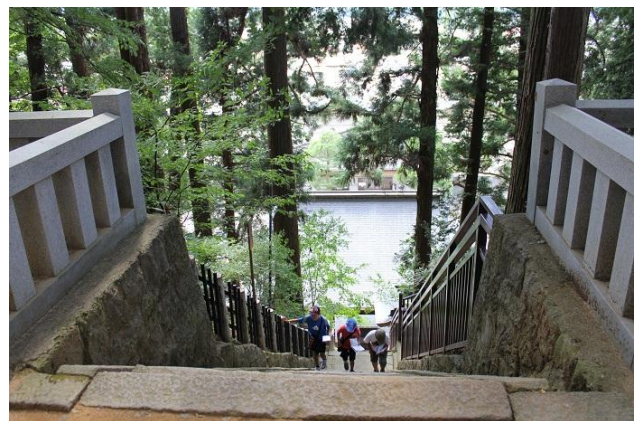
桜山八幡宮の祟り石(たたりいし)へ