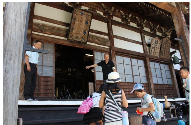
次は映芳寺(えいほうじ)にて