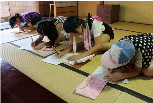
感想をまとめて・・・