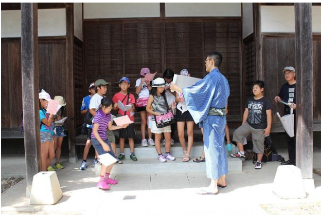
金森氏について学習