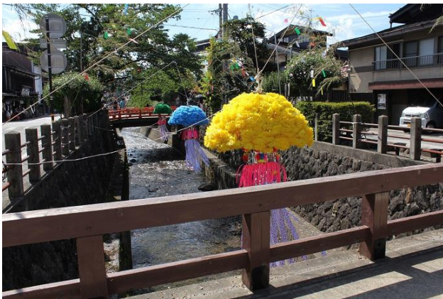
江名子川の七夕飾り