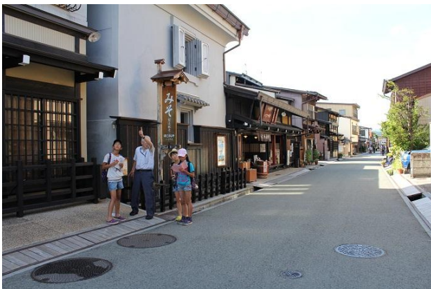
修理や修景の実例を学習