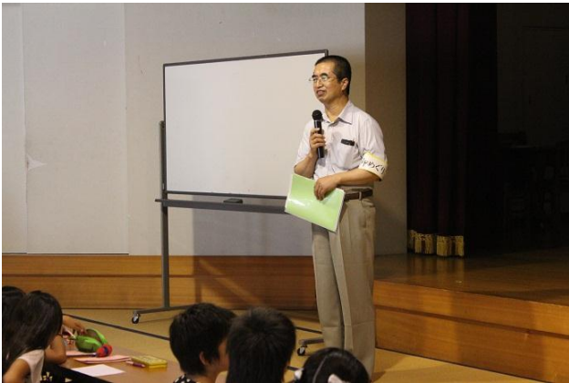
宮川子ども伝承部会長のあいさつ