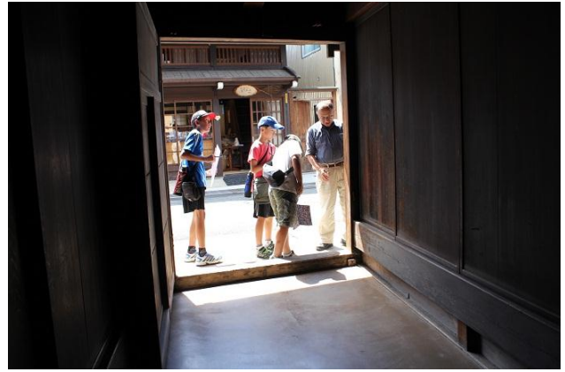
高桑家で町家の構造や生活を学習