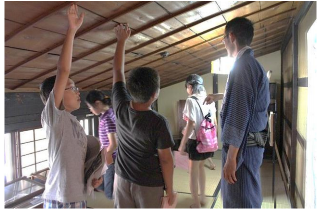
町家内部の説明や当時の暮らしを学習