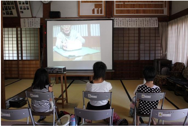
暎芳寺では高山の伝統である「飾り物」を学習