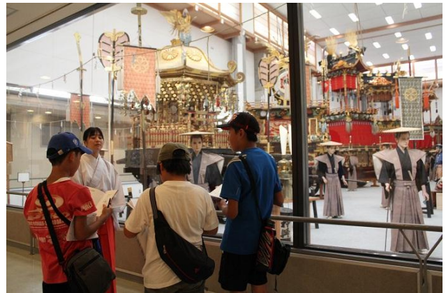
屋台会館で祭りや屋台について学習