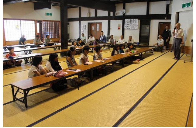
別院で説明を聞く