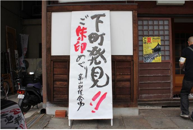
豪快な看板でおもてなし