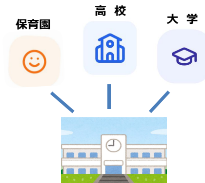
高山市立朝日学園 (仮称)