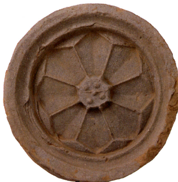
飛驒市・寿楽寺廃寺跡出土軒丸瓦 (岐阜県文化財保護センター蔵)