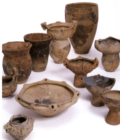
高山市・赤保木遺跡出土縄文土器 (岐阜県文化財保護センター蔵) ※会場で展示されている縄文土器は写真の一部です。