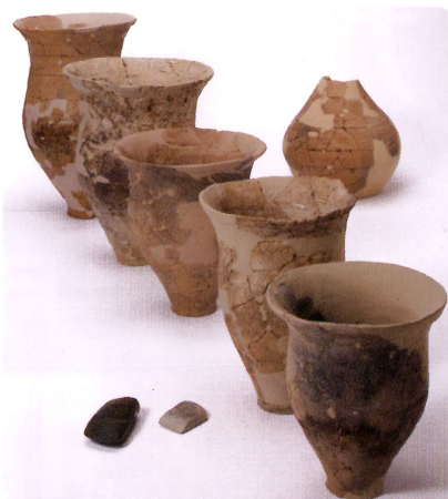
高山市・ウバガ平遺跡出土弥生土器・石器 (岐阜県文化財保護センター蔵) ※会場で展示されている弥生土器は写真の一部です。