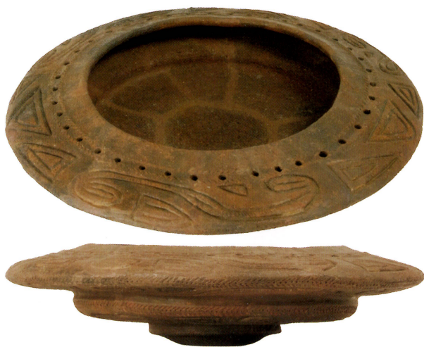
国重要文化財・浅鉢形土器／高山市・糠塚遺跡出土 (高山市蔵)