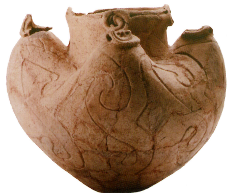
高山市・岩垣内遺跡出土縄文土器 (岐阜県文化財保護センター蔵)