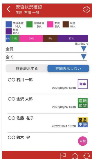
▲ 災害モードに切り替え時 安否状況一覧 画面イメージ

いつも使っているアプリだから安心 最寄りの情報を慌てずに取得 いち早い避難行動へ