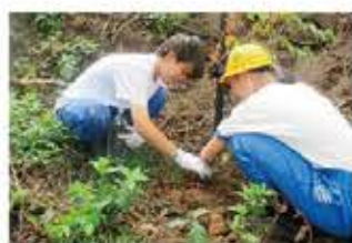
「すずらん高原SDGsの森」地域活性化事業〈複数年度事業〉 (御嶽鈴蘭高原観光開発株式会社)