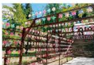
風がつなぐ平和の祈り「かざぐるままつり」〈単年度事業〉 (かざぐるままつり実行委員会)