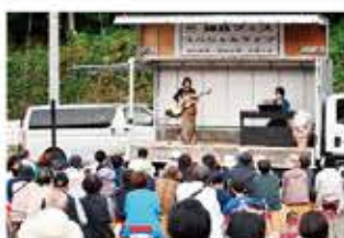
柳島にぎわいプロジェクト〈複数年度事業〉 (柳島にぎわいプロジェクト実行委員会)

地域の「これから」をとともに創る 〜地域を守り育て、そして未来につなぐための人づくり〜