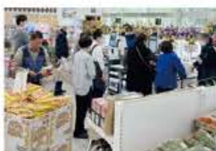
奥飛騨の暮らしと観光を結ぶ拠点づくり〜奥飛騨スーパーの挑戦〜〈単年度事業〉(有限会社 柏木商店)