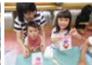
なかよしクラフト

児童館では、遊びを通じてこどもの自律性や社会性を育み、安心して過ごせる「居場所」を提供しています。また、こども家庭支援の拠点として、家庭相互の交流の場や、地域との連携を深める役割も担っています。