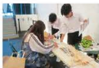
宮笠を守ろう〜みややんプロジェクト〜〈単年度事業〉 (高山市立宮中学校生徒有志)