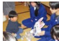
高校生との交流会