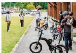
アンダーツーリズムから町興しを!〈単年度事業〉 (飛騨あさひ観光協会)