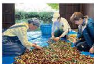
未来の子もたちへ、守る!繋げる!地域の食文化を!〜なつめお土産品開発プロジェクト〜〈単年度事業〉 (みんなの庭)