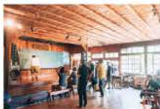
みんなで作ろう、野麦のお風呂と大地の再生〈複数年度事業〉 (野麦学舎保存会)