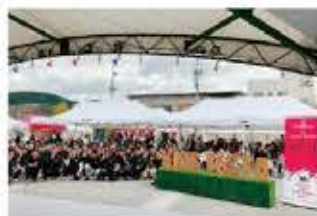
キッズフェスタ2025〈単年度事業〉 (高山商工会議所青年部会)