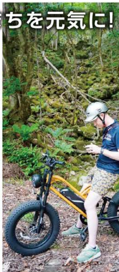
▲久々野の魅力探し(新しい自然資源の発見)に取り組む協