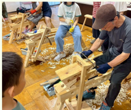
FOREST CRAFT STUDIO

木のおもちゃで遊べるコーナーとして無料開放しています。 貸切※もできます。和の文化を伝える講座や座談会などでのご利用はいかがでしょう。