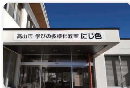
■ 学びの多様化教室「にじ色」