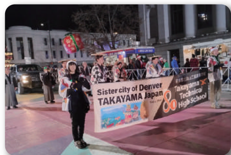
■ デンバー市 高校生派遣

■国内外の姉妹友好都市などとの継続的な交流により、産業経済をはじめとした地域の活性化や人々の心の豊かさの創出を図るとともに、広い視野を持った次世代の人材育成を図ります。