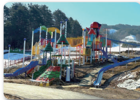
■ 原山市民公園整備