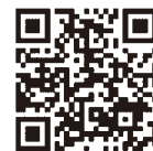
認証キーの取得方法 発注者への提出方法