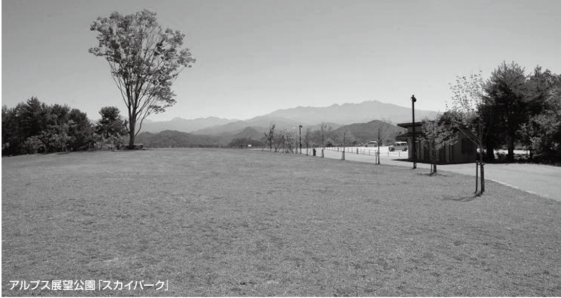
アルプス展望公園「スカイパーク」

老朽化した高山市営火葬場の改築に向け、市では施設の規模や内容、位置などについて検討を進めてきましたが、このたびアルプス展望公園「スカイパーク」の一部（西側部分）を新火葬場の最終候補地として選出し、地元町内会への説明を行いました。