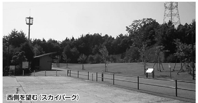
西側を望む(スカイパーク)