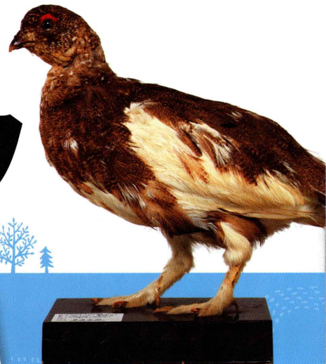
高等学校に保管されていた戦前のライチョウの剥製 (所蔵: 岐阜県博物館)