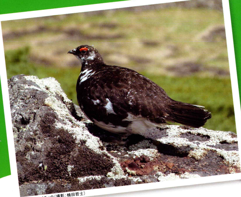
乗鞍岳のライチョウ