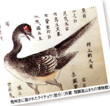
飛騨志に描かれたライチョウ(部分)