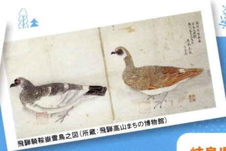
飛騨騎鞍嶽雪鳥之図 (所蔵: 飛騨高山まちの博物館)