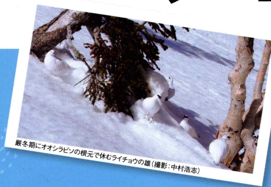
越冬期にオオシラビソの根元で休むライチョウの雄