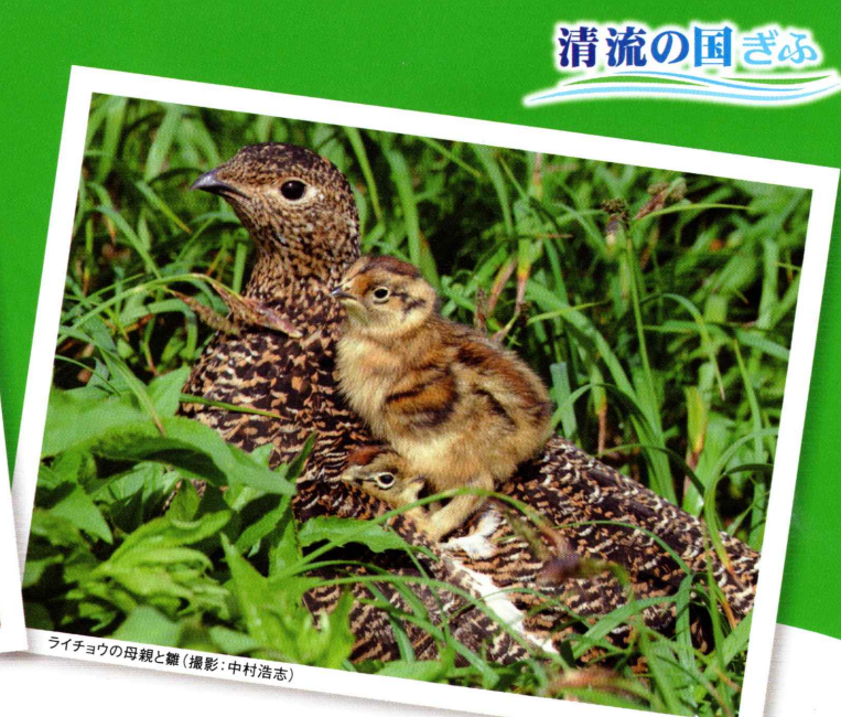
ライチョウの母親と雛